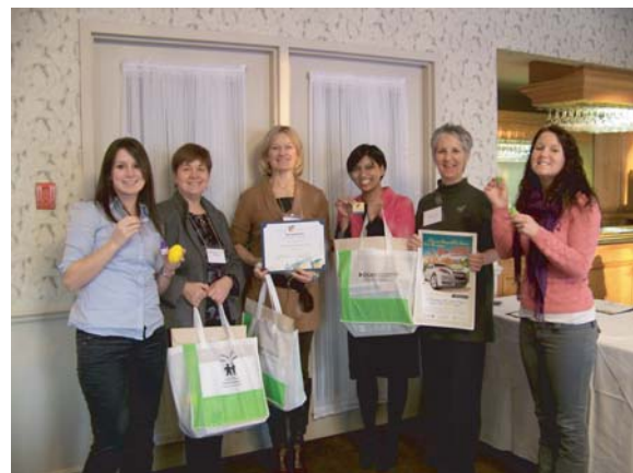
Atelier sur les champions CT en 2009 à Gananoque (Ontario)