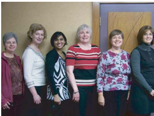
L'équipe 2008-2009 de cessation du tabagisme de la santé publique