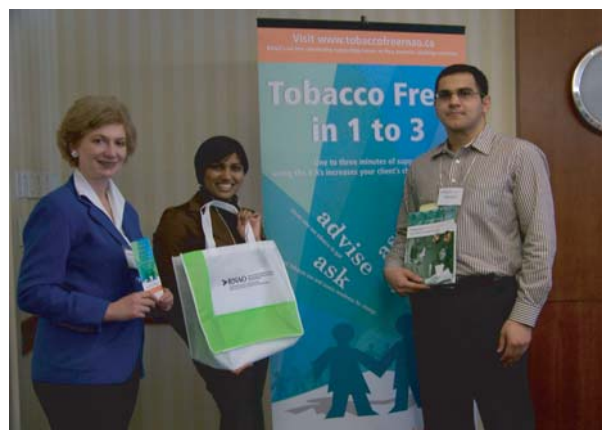
Atelier sur les champions CT en 2009 à North York (Ontario)